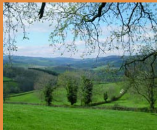
Panorama sur le Mâconnais

à l'inventaire supplémentaire des monuments historiques) de l'église Saint-Jean-Baptiste.