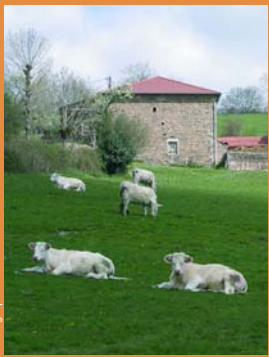
Ferme et vaches en Golaïne