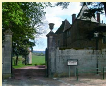
Château de Tramayes