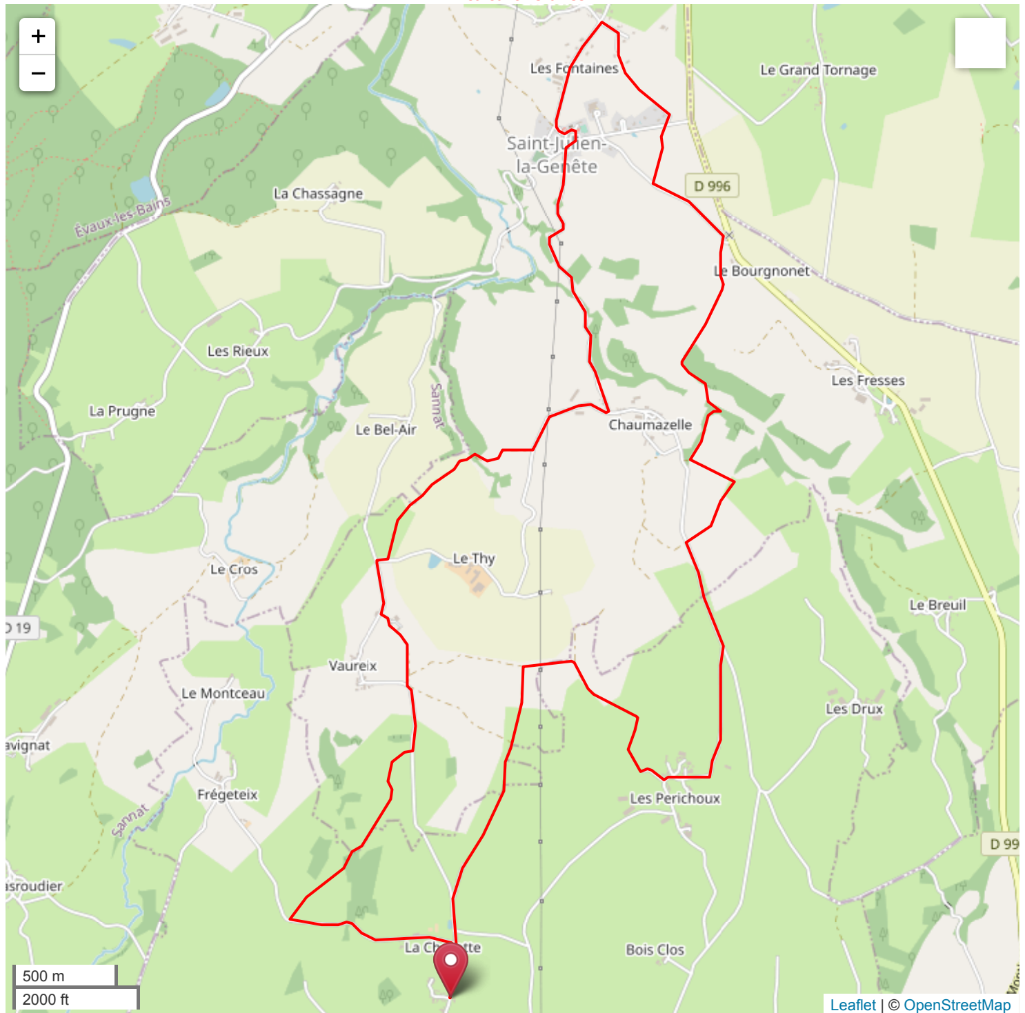
Circuit Les confitures de Bayards - 14.3 km - 3h - Circuit moyen