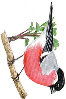
BOUVREUIL PIVOINE / DESSIN P. R.

Ancien bourg médiéval, Saint-Pierre-le-Moutier possède divers attraits tels que son église romane du XII e siècle, ses ruines et sa campagne verdoyante peuplée de troupeaux de charolais.