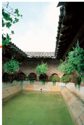
Le lavoir de Lévigny.

À la patte-d'oeie, prendre à gauche et plus loin, à droite, la petite route. Au hameau, suivre à gauche. 7 À la sortie, dans le grand virage à gauche de la route, prendre complètement à droite ( croix ) le chemin de terre et continuer par une petite route jusqu'à Lévigny. 8 Au centre du hameau ( lavoir ), tourner deux fois à gauche, monter le chemin des Gérards et la 1 re route à droite. 9 Dans le virage à droite, emprunter le chemin empierré à gauche. En bas, passer sous l'autoroute, et tourner tout de suite à droite en suivant un chemin gravillonné. Laisser l'école sur la droite et tourner à